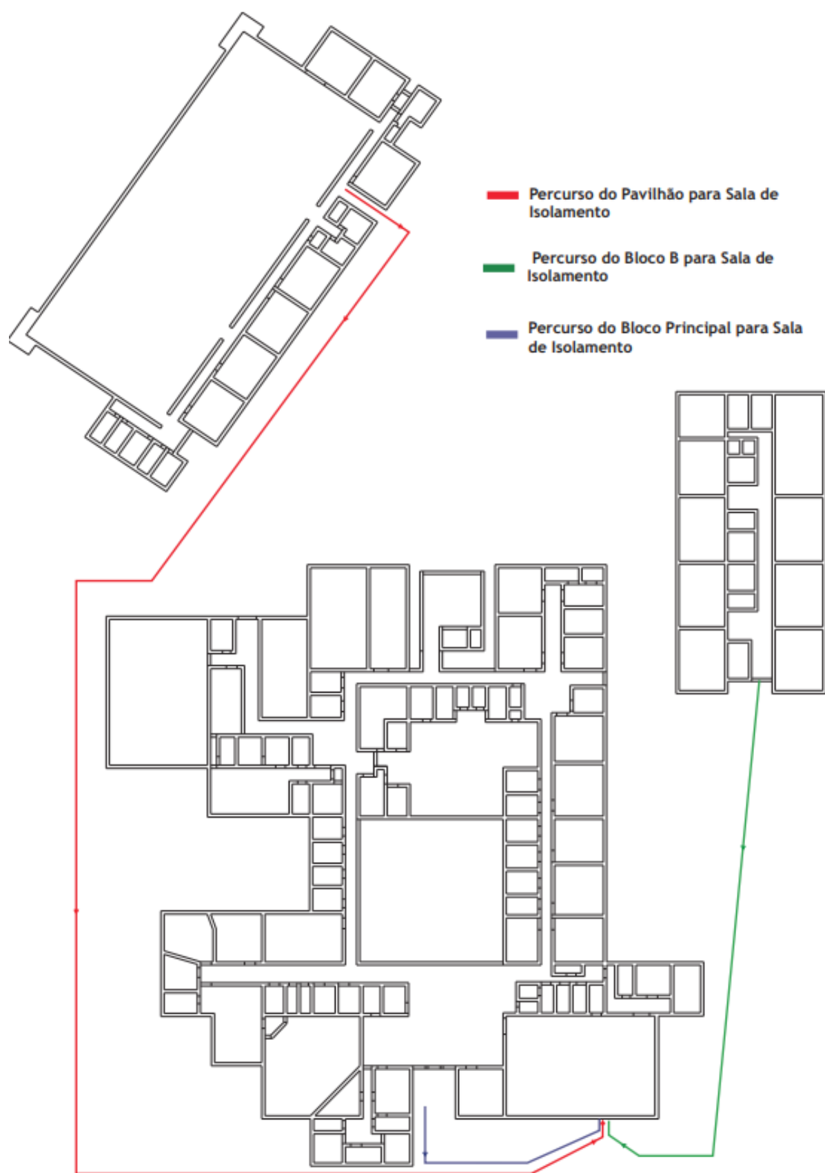
Figura 2 – Circuitos a seguir para o acompanhamento de um caso suspeito para a sala de isolamento