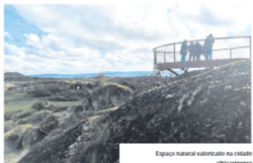
Espaço natural valorizado na cidade albacarense

O percurso terá vários pontos de animação artística e atuações musicais