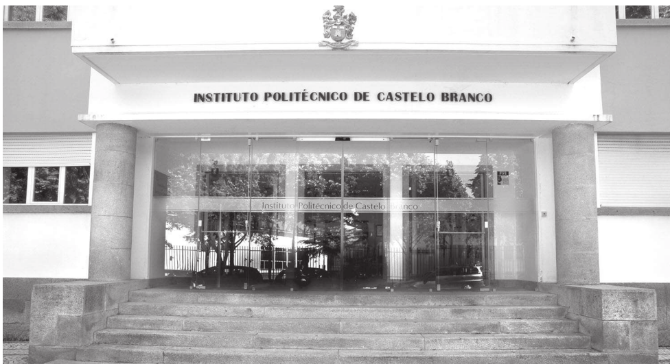
A auditoria aponta como pontos fortes o envolvimento de todos os colaboradores e a forte cultura organizacional da Instituição