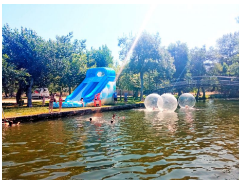
EDUCAÇÃO Penamacor: Academia Explorar e Aprender terminou mais uma edição de verão