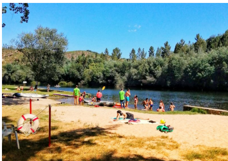
EDUCAÇÃO Iniciativa do Município de Oleiros animou Férias de Verão das crianças