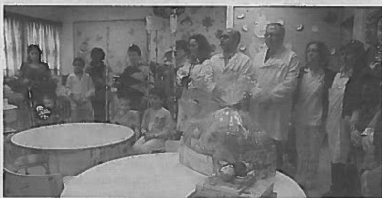
Brinquedos são usados mas estão em bom estado

Os brinquedos doados na semana passada aquele hospital vão ser utilizados pelas crianças interna-