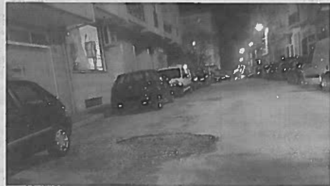
Câmara vai requalificar Quinta Pires Marques

O prazo de execução da obra previsto é de seis meses.