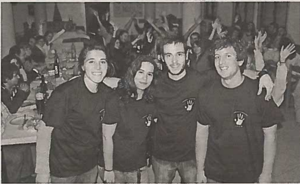
Residência de Estudantes