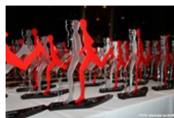
Gala Troféu Gazeta Atletismo 2018