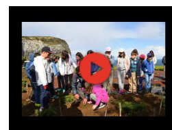
Castelo Branco nos Açores