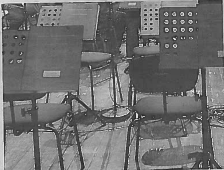
Audições decorreram em vários países

Puderam candidatar-se instrumentistas com idades compreendidas entre 17 e 25 anos (em dezembro de 2013), dando a Gulbenkian preferência aos candidatos com frequência de ensino superior ou licenciatura completa nos seguintes instrumentos: violino, viola, violoncelo, contrabaixo, flauta, oboé, clarinete, fagote, trompa, trompete,