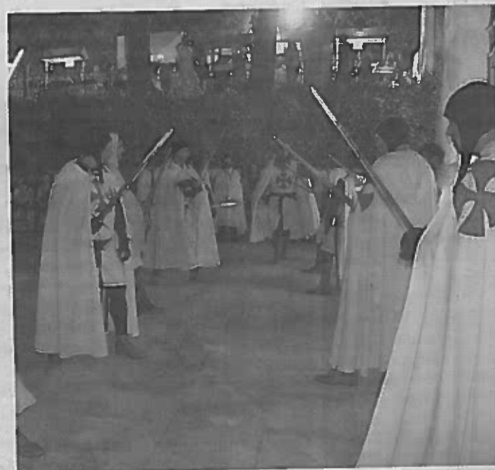
Membros da Ordem dos Templários

O assalto ao castelo voltou a ser um momento assistido por muitos quantos visitaram a Feira, organizada pela Câmara de Castelo Branco, Junta de Freguesia, Associação Comercial e Industrial, e da Outrem - Associação de Defesa do Ambiente e Património.