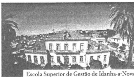
Escola Superior de Gestão de Idanha-a-Nova

Dez trabalhadores do Município de Idanha-a-Nova que pretendam frequentar a Licenciatura em Administração Pública vão receber comparticipação da autarquia para o pagamento das propinas. Esta licenciatura virá a ser lecionada na Escola Superior de Gestão de Idanha-a-Nova (ESGIN) no próximo ano letivo e, segundo a informação prestada pela autarquia, para receberem este apoio, os trabalhadores terão de ser residentes e recenseados no concelho.