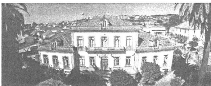
A licenciatura em Administração Pública vai funcionar já no próximo ano letivo

É uma medida aprovada por unanimidade, que vai beneficiar 10 alunos trabalhadores da autarquia Idanhense