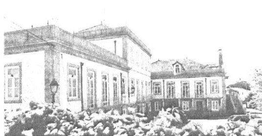
O novo curso será ministrado em Idanha-a-Nova