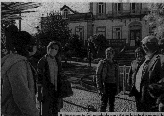
A governante foi recebida em vários locais do concelho

Berta Nunes foi recebida na sala de sessões da autarquia, onde o presidente Armindo Jacinto referiu a importância de "o Governo e autarquias trabalharem em conjunto para apoiar o acolhimento e integração de cidadãos migrantes e de cidadãos portugueses que regressaram ou pretendem regressar ao nosso país".