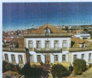
A Resolução preconiza uma solução para a ESGIN

Por outro lado é destacado que “merece o reconhecimento deste Município a forma como o Movimento pela Autonomia da Escola Superior de Gestão de Idanha-a-Nova, movimento cívico, apartidário e independente, que desencadeou este processo junto da Assembleia da República, tem lutado pela autonomia e sede