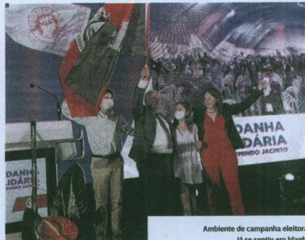
Ambiente de campanha eleitoral já se sentiu em Idanha

Ao som da canção “Vangelis”, que o PS aplicou nos congressos do então secretário-geral do PS, António Guterres (1995), com bandeiras amarelas, vermelhas e brancas do partido distribuídas pelos ocupantes das cadeiras distanciadas, com projeções em vídeo num enorme ecrã na traseira do palco e transmissão “online”, o cenário parecia já de autêntica campanha eleitoral