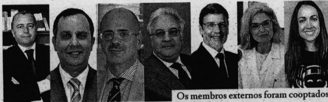
Os membros externos foram cooptados