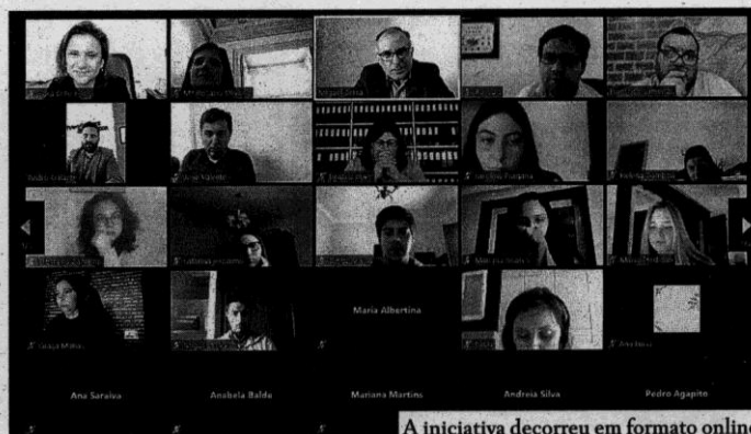
A iniciativa decorreu em formato online

O webinar teve cerca de 80 participantes e permitiu abordar o acesso à profissão, os métodos de trabalho e de gestão processual, o desempenho das novas funções jurídicas e as dificuldades atu-