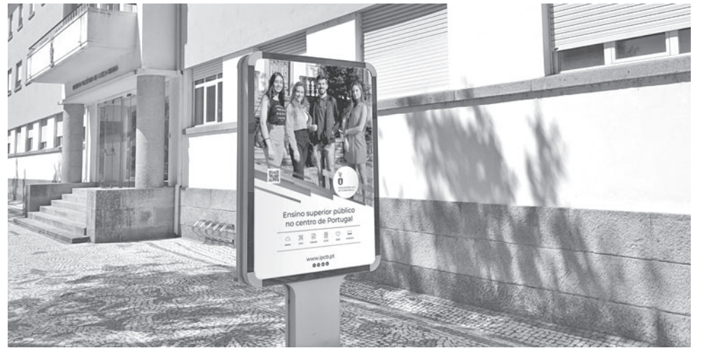
O número de alunos tem vindo sempre a crescer

Aos estudantes colocados nas licenciaturas pela via do CNA juntam-se mais de 300 estudantes colocados através de outros regimes de ingresso, como Maiores de 23, titulares de