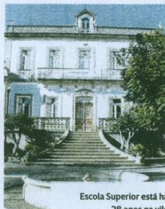
Escola Superior está há 28 anos na vila