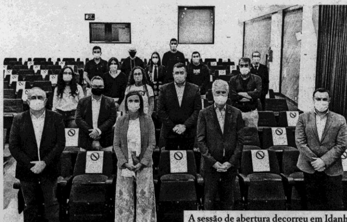
A sessão de abertura decorreu em Idanha

Em nota enviada ao nosso jornal, o politécnico explica que "o curso tem como ob-