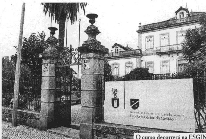
O curso decorrerá na ESGIN

O curso será "lecionado em regime de E-learning, em horário pós-laboral, às sextas-feiras e sábados e está organizado em 6 módulos - Direito Civil, Direito Processual Civil, Direito Fiscal, Direito do Notariado, Direito Registral, e Estatuto e Deontologia, com um total de 108