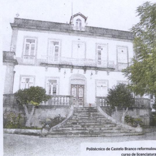
Politécnico de Castelo Branco reformulou curso de licenciatura

O IPCB explica que "numa altura em que o turismo no Interior apresenta um grande potencial de crescimento, o politécnico alinha a sua formação com as necessidades do território, e aposta na formação de recursos humanos qualificados nesta área, permitindo aos futuros profissionais permanecer e investir na região após concluírem os seus ciclos de estudos". O curso de turismo tem sido dos mais dinâmicos, com organização de seminários e até participação no Geo-Hotel em Monsanto. No ano passado, o Dia Mundial do Turismo foi igualmente assinalado nesta escola superior com mais de 20 anos.