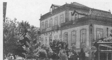
Instituto Politécnico pelas suas opções políticas, desrespeitando a autonomia das instituições de Ensino Superior".

Por isso defende que "não é justo que o Governo responsabilize o Instituto Politécnico pelo subfinanciamento que o Governo lhe impõe, quando a verba transferida em Orçamento do Estado nem sequer cobre as despesas correntes. Nem é justo que o Governo responsabilize o