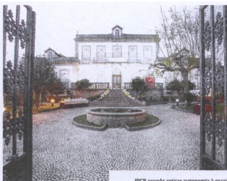
IPCB propôs retirar autonomia à escola

Com 28 anos de existência, a ESGIN tem 600 estudantes e um crescimento que este ano ultrapassou os 20 por cento de alunos no Concurso Nacional de Acesso e o maior número de alunos internacionais do IPCB.