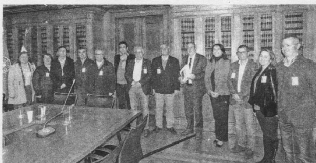
O Movimento pela Autonomia da ESGIN esteve na Assembleia da República

A petição entregue dia 17, na Assembleia da República, defende a permanência da ESGIN em Idanha-a-Nova e a sua autonomia