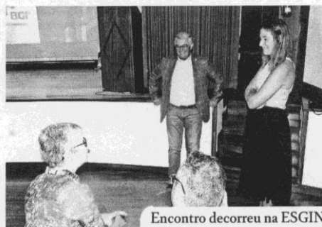
Encontro decorreu na ESGIN

O Observatório de Produtores de Idanha-a-Nova esteve reunido recentemente na Escola Superior de Gestão, num encontro em que os produtores de Idanha-a-Nova "foram convidados a fazer uma apresentação da sua empresa e de alguns desafios que atravessam no seu negócio para uma plateia de investigadores, investidores e empresas", informa a Câmara Municipal de Idanha-a-Nova. Este encontro pretendeu motivar a partilha de informação para encontrar soluções