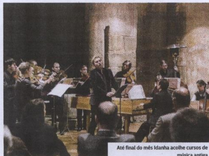
Até final do mês Idanha acolhe cursos de música antiga

Os CIMA – Cursos Internacionais de Música Antiga, oferta formativa de grande relevo nacional na área da música antiga, estão a realizar-se mais uma vez no Palácio Herminia Manzarra, nas instalações da Escola Superior de Gestão de Idanha-a-Nova, até 31 de agosto. Albergando um conjunto de iniciativas tais como concertos, workshops de dança histórica e espectáculos semi-encenados, os cursos tentam aproximar a comunidade local e o meio musical, em particular a população que menos acesso tem a