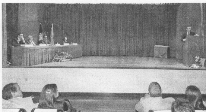
A cerimónia foi presidida pelo secretário de Estado João Sobrinho Teixeira

Sobrinho Teixeira considera que "a rede de Ensino Superior em Portugal é, por ventura, o maior património de obra do pós-25 de Abril" e, nesse sentido, aplaudiu "o valor da ESGIN que lhe permite ter uma grande pujança e encontrar oportu-