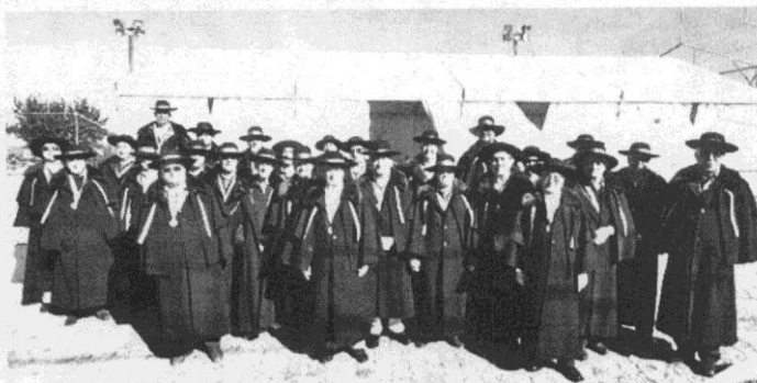
Os confrades voltam a encontrar-se este mês

A confraria informa também que estabeleceu um protocolo com a Câmara de Idanha-a-Nova e com a Escola Superior de Gestão (Licenciatura em Gestão Hotelaria) do Politécnico