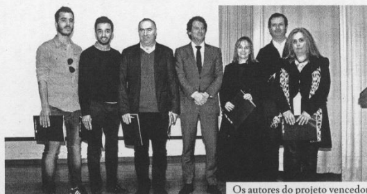
Os autores do projeto vencedor

O vencedor da edição deste ano foi o projeto Go4AR, o qual, segundo os seus autores, consiste numa aplicação de realidade aumentada apenas "à área do turismo, que permite a apresentação ao utilizador de conteúdo interativo, potenciando a