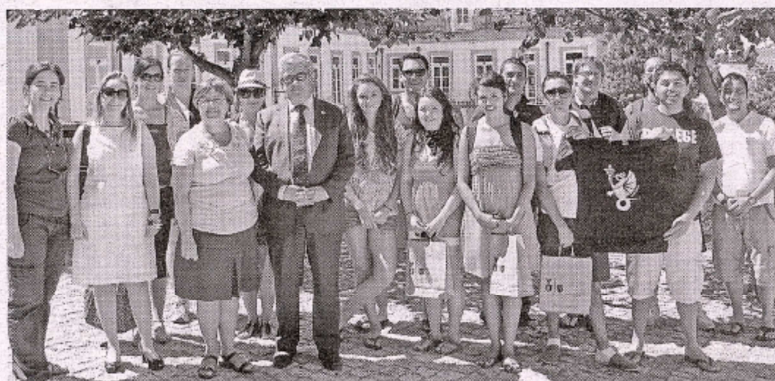
Os alunos estrangeiros com os responsáveis do curso e autoridades locais