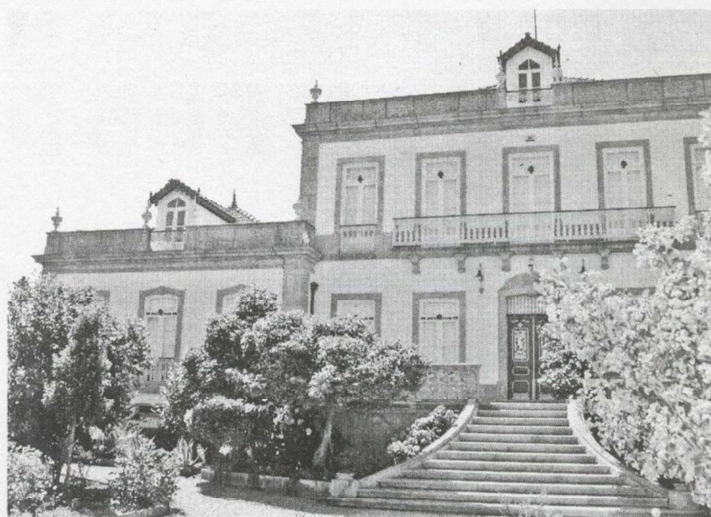
A Escola alargou a oferta formativa

Para além daquela oferta, a escola tem também disponível o CET em Organização e Gestão de Eventos. Nesta oferta pretende-se que os