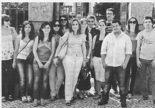
Alunos e docentes da escola superior de Idanha marcam pontos nesta competição

mês de Maio, com dez equipas do curso de Contabilidade e Gestão a disputarem esta competição, juntamente com 640 equipas de todo o país. "O objectivo é conseguir a melhor cotação na bolsa