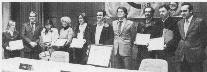
O IPCB recebeu os certificados de qualidade

O Instituto Politécnico de Castelo Branco (IPCB) recebeu, esta segunda-feira, a certificação do seu Sistema de Gestão da Qualidade. O certificado foi entregue pela Associação Portuguesa de Certificação (APCER) numa cerimónia onde os responsáveis pelas escolas e pelo serviço de