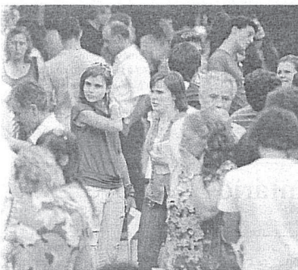
Engenharia Civil sem candidatos

ouve 14 cursos com menos colocações – o mínimo de dois é a fiação da tutela: cursos com menos correm o risco de não ser apoiados financeiramente e de ser um encargo pesado para as instituições se decidam manter.