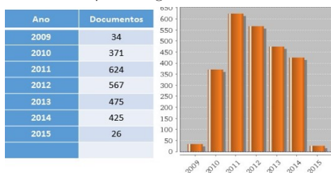
Figura 1 – Documentos depositados por ano no RCIPCB

Esta atividade traduziu-se no crescimento do Repositório em termos de documentos depositados por ano (Fig. 1) transformando-o numa ferramenta incontornável de partilha, difusão, organização e preservação da produção científica do IPCB em suporte digital.