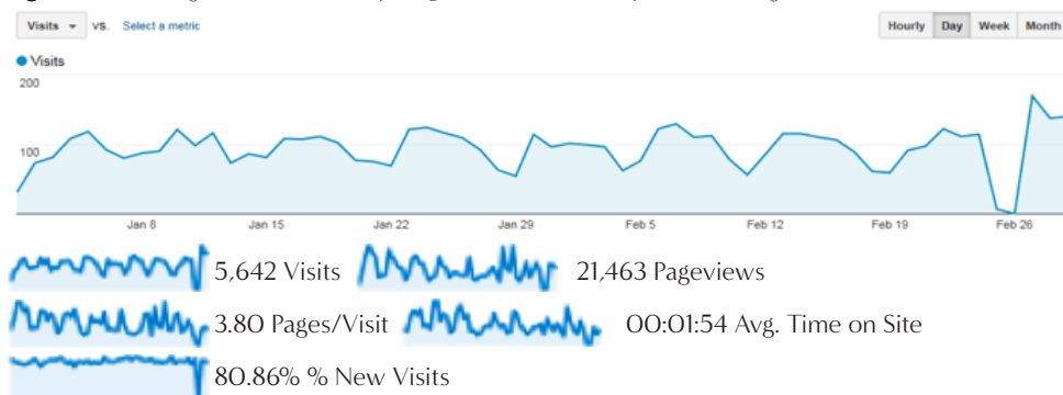
Figura 1 – Utilização do RCIPCB (tipologia da visitas e tempo de utilização)

Através da figura 1 verificamos que o RCIPCB registou, para o período referenciado (de 1 de janeiro a 29 de fevereiro), um total de 5642 visitas, sendo que o tempo médio de cada visita foi de cerca de 2